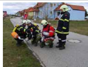
Vorbereitung für Ausbildungsprüfung Löscheinsatz

22 Veranstaltungen 176 Teilnehmer 604 Mannstunden