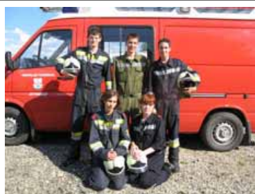
Die „PFMs“ der Gemeinde beim Modul Truppführer