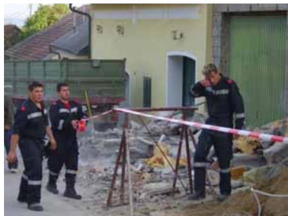
Sicherungsmaßnahmen nach Mauereinsturz in der Kellergasse (04.06.)

Bei diesen 47 Einsätzen wurden insgesamt 244 Personen eingesetzt und 313 Mannstunden geleistet. Weiters wurden mit den Fahrzeugen 333 Kilometer zurückgelegt.